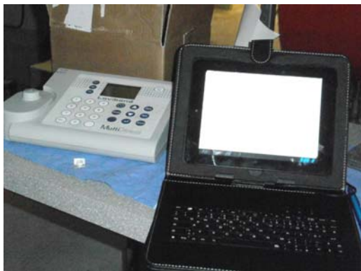
Abb. Tablet in Mappe mit integrierter Tastatur, z. B. zum Aufzeichnen der Chlorwerte

Nützlich ist eine in der Mappe integrierte Tastatur, mit der Kommentare oder Werte