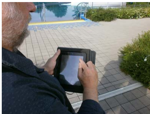
Abb. Tablet in Mappe zur Dokumentation der Maßnahmen beim Kontrollgang.

Die EXCEL-Datei des APPL-SYSTEM®-Betriebstagebuchs besteht aus einem Arbeitsblatt „Verfahren“ und einem oder mehreren Arbeitsblättern bzw. Formularen „Plan“.